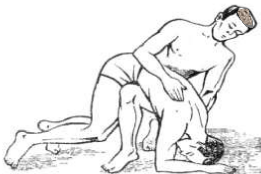
Рис. 1. Удаление воды из дыхательных путей утопавшего.

Если пострадавший пришел в сознание и его дыхательные пути открыты, то он в состоянии говорить или издавать крик. В этом случае дайте пострадавшему горячее питье, тепло укутайте и ждите врача (вызовите скорую медицинскую помощь, если она еще по каким-то причинам не вызвана, или как можно быстрее доставьте спасенного в лечебное учреждение).