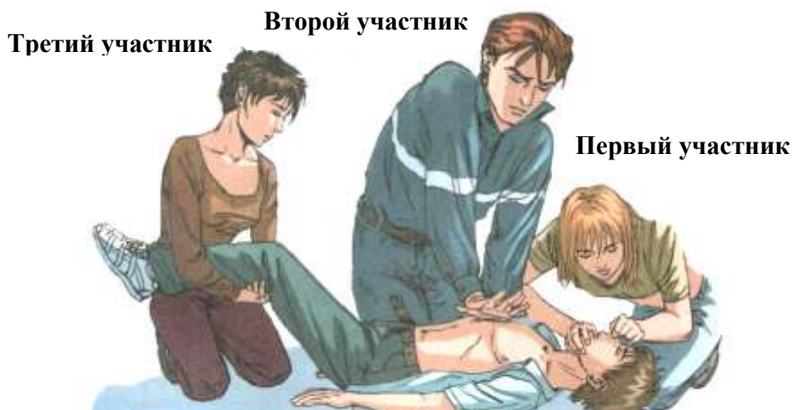
Рис. 7. Проведение сердечно-легочной реанимации втроем.

3) привлечь к выполнению комплекса сердечно-легочной реанимации любого необученного человека. Сначала новичку следует доверить поддержание ног, а затем, по мере ротации участников, привлечь к проведению реанимации.