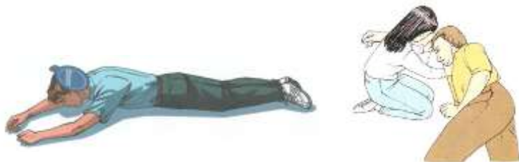
Рис. 5. Возможные варианты восстановительного (дренажного) положения пострадавшего.