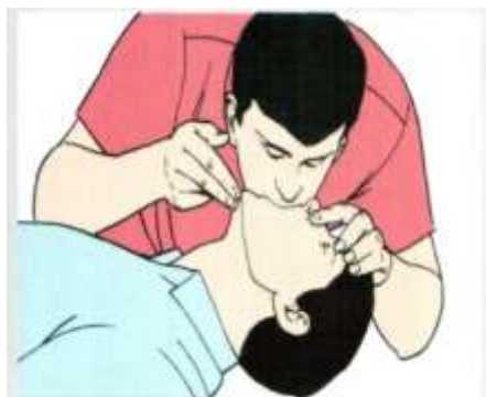
Рис. 4. Искусственная вентиляция легких методом «изо рта в рот».