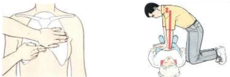
Рис. 6. Наружный (непрямой) массаж сердца.

4.3. Сделайте 15 надавливаний на грудину: